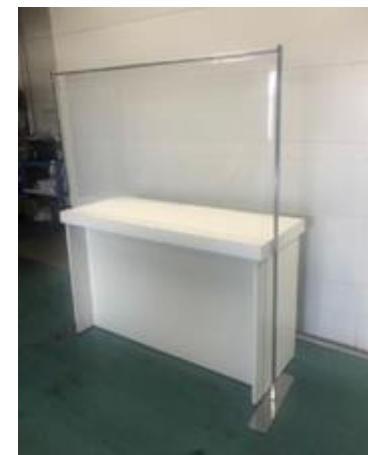
受付用飛沫防止パテーション