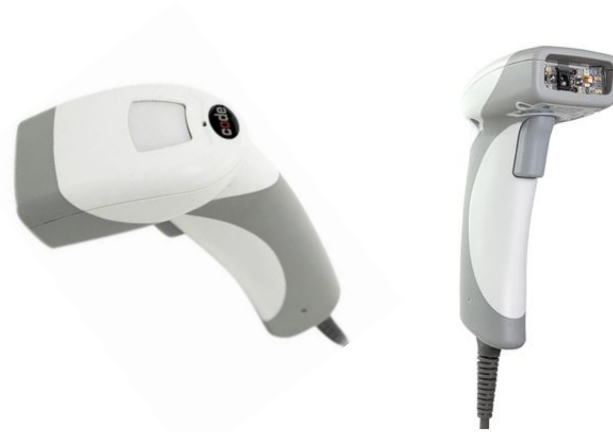
ハンディタイプバーコードリーダー

非接触型リーダーのため、安心してご利用いただけます。 ご要望に応じた機材および運用方法を、ご提案いたします。