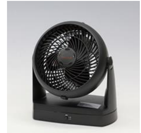
サーキュレーター