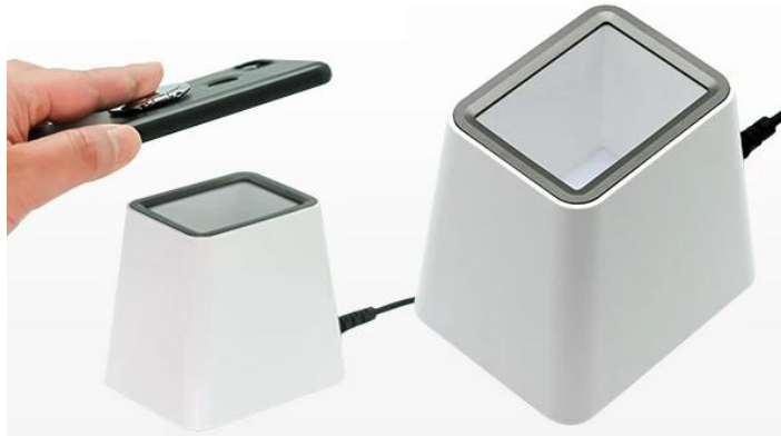
据置型バーコードリーダー